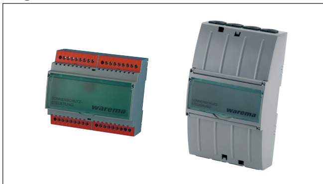
Abb. 1 Hub 4 REG/AP

Durch den Einsatz des Hub 4 kann eine Verlängerung der WAREMA climatronic®- Busleitung auf maximal 3600 m erzielt werden.